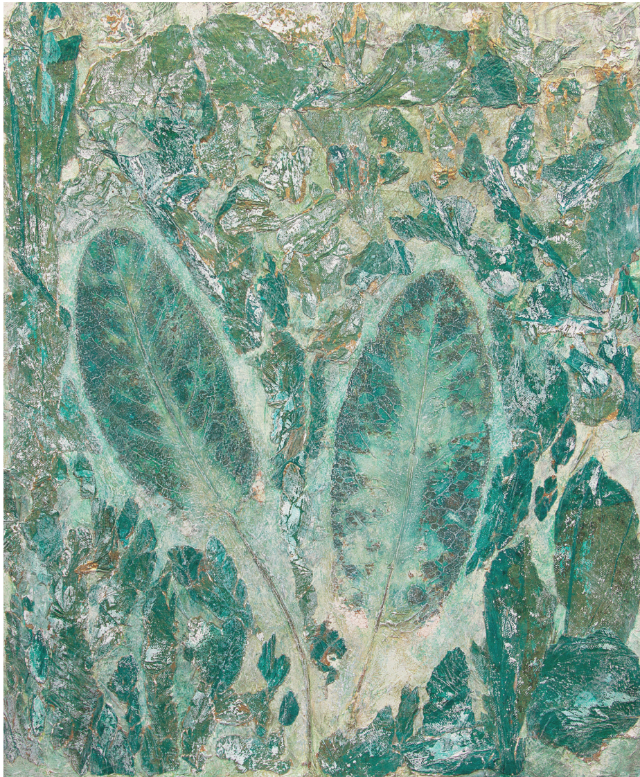
,'calming wilderness' - let it green